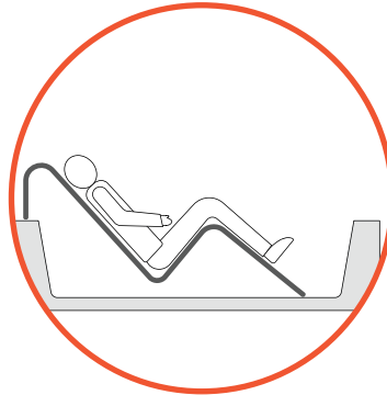
USO EN TINA